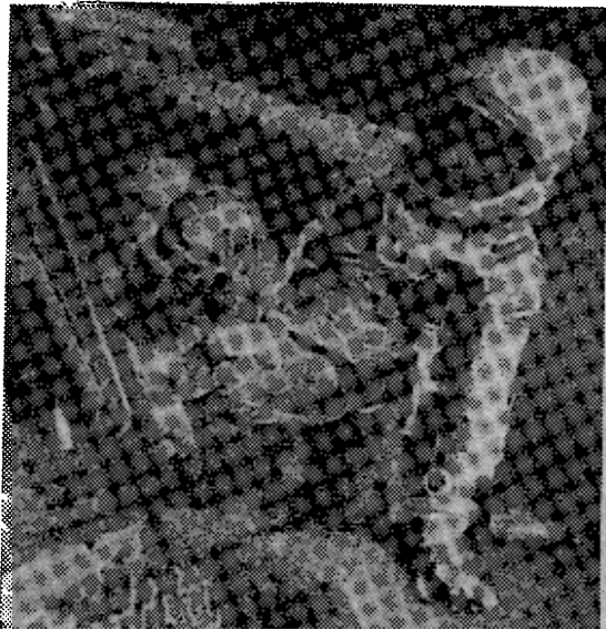
格伦20日在卡拉维拉尔角从发射架的第十一层跨入《阿特拉斯》火箭顶端的《水星》容器。